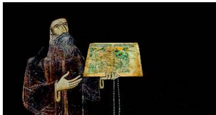
Λεπτομέρεια της σύνθεσης του εξωφύλλου της πρώτης έκδοσης (2002) για τη χαρτογραφία του Αγίου Όρους “Όρους Άθω γης και θαλάσσης περίμετρον, χαρτών μεταμορφώσεις”.

δοση αυτού του μικρού χαρτογραφικού θησαυρού που αποτελούν οι χάρτες του Αγίου Όρους, μια εργασία που οδήγησε το 2002 στην έκδοση του πρώτου βιβλίου που αφιερώνεται στη χαρτογραφία και τους χάρτες του Αγίου Όρους με τίτλο Όρους Άθω γης και θαλάσσης περίμετρον, χαρτών μεταμορφώσεις , από το τότε Εθνικό Κέντρο Χαρτών και Χαρτογραφικής Κληρονομιάς – Εθνική Χαρτοθήκη, με έδρα τη Θεσσαλονίκη.