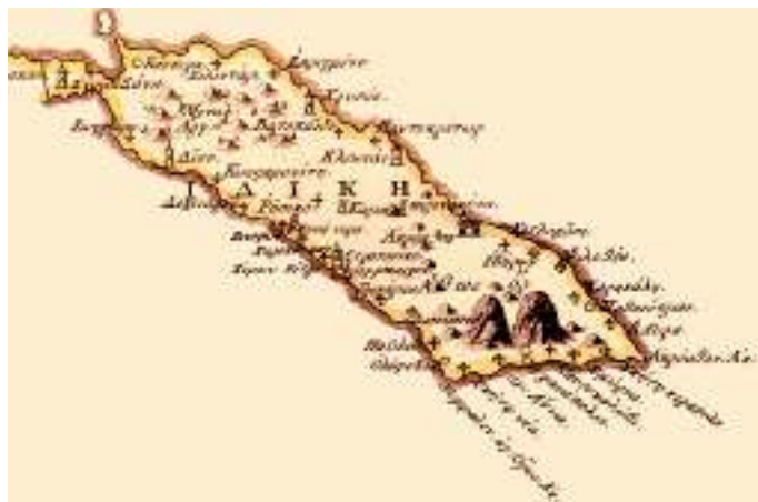
Το Όρος στη Χάρτα του Ρήγα (1797), με τον Άθω ως δίκωρφο.

Ελλάδας του Άνθιμου Γαζή, αλλά και από τους χάρτες τις νέας επιστημονικής περιόδου της χαρτογραφίας, φαίνεται ανάγλυφα η ανάδειξη της “νήσου” του Αγίου Όρους στην ιστορία των χαρτών, καθώς και κάθε είδους