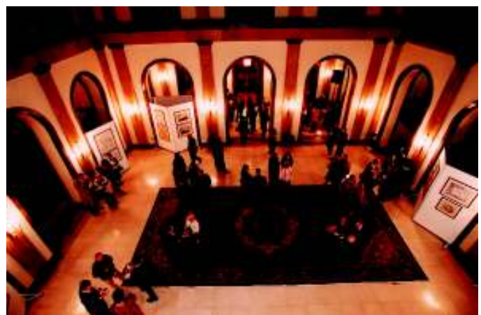
Γενική άποψη της πρώτης έκθεσης των χαρτών της Αγιορειτικής Χαρτοθήκης στο εξωτερικό: Δημαρχείο του Βελιγραδίου, 2002.

Εκθέσεις, που συνόδευαν το βιβλίο αυτό, μαζί με μια σύντομη παράγωγη έκδοση στα ελληνικά, αγγλικά και σερβικά, έγιναν το 2002 στο Δημαρχείο του Βελιγραδίου, το 2005 στο Μουσείο Βυζαντινού Πολιτισμού Θεσσαλονίκης και το 2006 στο Μουσείο Τέχνης του Ελσίνκι, πριν τη νέα έκθεση του 2010 στην Κοζάνη.