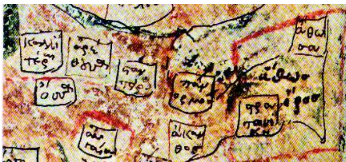
“άθω όρος”. Η απεικόνιση στο χειρόγραφο βατοπεδινό κώδικα, το παλαιότερο σωζόμενο, 13ος - 14ος αιώνας.

Αντίθετα, εκείνες οι θεμελιώδεις “εικόνες” του γεωγραφικού χώρου, που στην ιστορία του παγκόσμιου πολιτισμού είναι γνωστές ως “χάρτες”, αν και πολύτιμες, αποτελούν αναφορικά με το Άγιον Όρος ένα σχεδόν άγνωστο απόθεμα κληρονομιάς και πλούτου, το οποίο αξίζει να συλλεχθεί, να τεκμηριωθεί και να αναδειχθεί στο ευρύ κοινό, ως ένα ουσιώδες συμπλήρωμα των απεικονίσεων του χώρου στο οποίο εξελίχθηκε ιστορικά το όλον αγιορειτικό θαύμα.