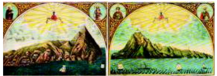
Απεικόνιση των αναγλύφων όψων του Όρους της ρωσικής εικονογραφικής παράδοσης (19ος αι.).

Ελλάδας του Άνθιμου Γαζή, αλλά και από τους χάρτες τις νέας επιστημονικής περιόδου της χαρτογραφίας, φαίνεται ανάγλυφα η ανάδειξη της “νήσου” του Αγίου Όρους στην ιστορία των χαρτών, καθώς και κάθε είδους