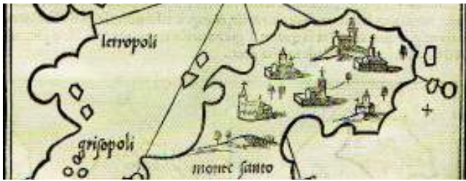
Το Όρος στο νησολόγιο του Bordone, 1528.