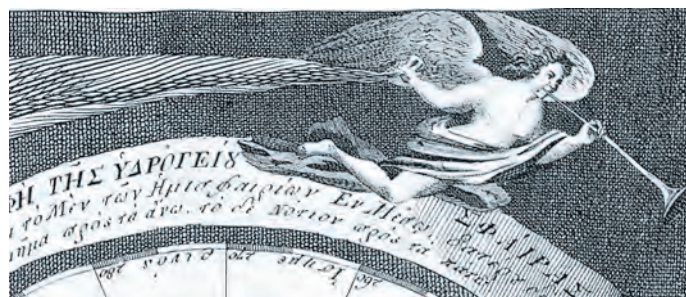
Άνθιμος Γαζής ο Μηλιώτης, “Άτλας ή χάρτης ...”, Βιέννη 1800.

Ένας μικρότερος ομότιτλος χάρτης του Νοταρά, χωρίς διακοσμήσεις και αφιερώσεις, τυπωμένος την ίδια χρονιά στην Πάδοβα, είναι αντίγραφο χάρτη του ολλανδού Jan Luys (Ουτρέχτη, 1692), της σχολής του γάλλου Sanson και προοριζόταν για διδακτική γεωγραφική χρήση. Και οι δύο αυτοί χάρτες του Χρυσανθου αποδεικνύουν την ενημέρωσή του στις χαρτογραφικές εξελίξεις, αλλά και στα εκπαιδευτικά πρότυπα της εποχής του.