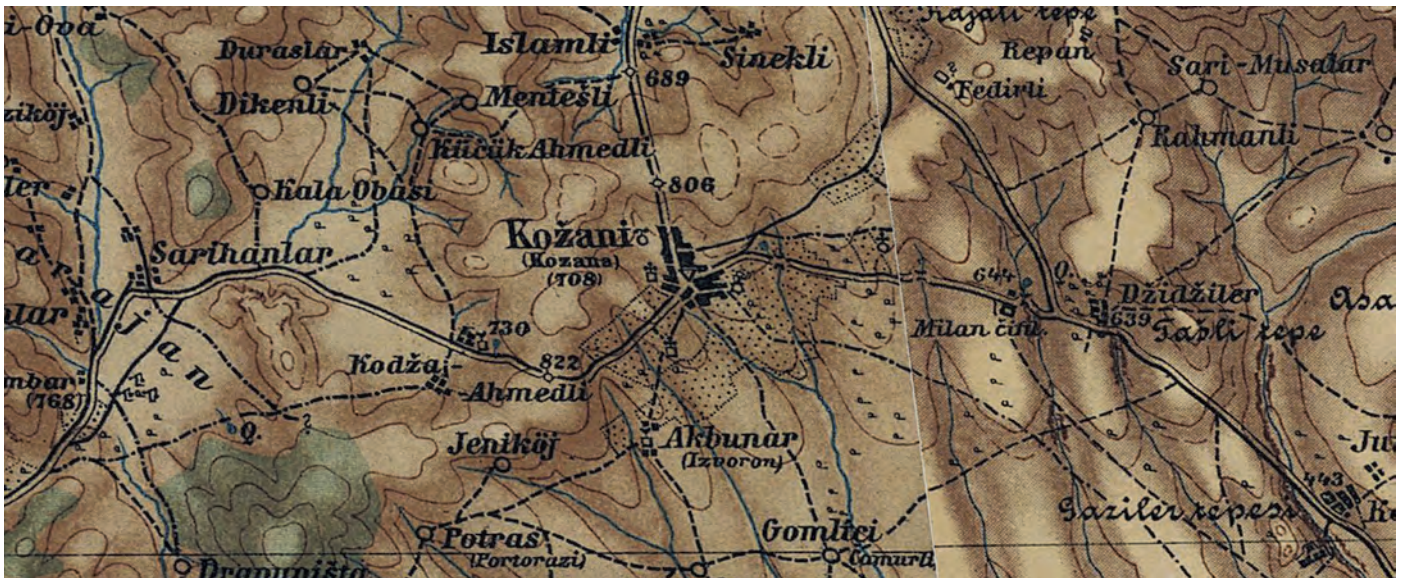
Επάνω: Η περιοχή της Κοζάνης σε σύνθεση δύο αυστριακών φύλλων-χάρτη της σειράς Generalkarte (1:200.000), από τα τέλη του 18ου - αρχές του 19ου αιώνα. Κάτω: Η ίδια περιοχή σε ελληνικό χάρτη της Χαρτογραφικής Υπηρεσίας Στρατού του 1913, με τα τοπωνύμια σε λατινική γραφή.