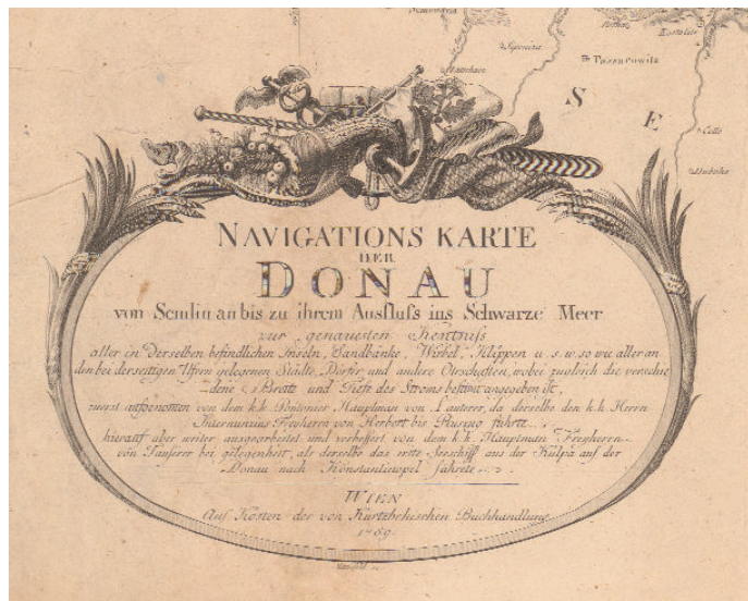
Το cartouche (εικονογραφημένο υπόμνημα) του οκτάφυλλου χάρτη Navigationskarte der Donau, Βιέννη 1789 (Συλλογή Δημοτικής Βιβλιοθήκης Κοζάνης).

Οι παλαιοί χάρτες που απεικονίζουν τον Δούναβη περιλαμβάνονται σήμερα στη χαρτογραφική κληρονομιά πολλών χωρών κατά το μήκος της ροής του, αλλά και στη χαρτογραφική κληρονομιά χωρών όπως η Ελλάδα, που βρίσκονται σε κάποια απόσταση, χάρη σε πολύ συγκεκριμένα και ειδικά ιστορικά αίτια. Αρκετές ακμάζουσες κοινότητες της ελληνικής Διασποράς άνθισαν ιδίως τον 18ο αι. κατά μήκος του “πολυεθνικού” Δούναβη, συμβάλλοντας στην κοινωνική, οικονομική και πολιτιστική ζωή των τοπικών πληθυσμών, όπως π.χ. στη Βιέννη, τη Βουδαπέστη, το Βελιγράδι και σε πολλές πόλεις της Ρουμανίας και των δυτικών ακτών της Μαύρης Θάλασσας. Μέλη των ελληνικών αυτών κοινοτήτων συγκαταλέγονται στους πρωτοπόρους του Νεοελληνικού Διαφωτισμού κατά τον 18ο αι. και του ελληνικού Αγώνα της Ανεξαρτησίας στις αρχές του 19ου αι., στους δωρητές πολιτιστικών και εκπαιδευτικών αγαθών (π.χ. βιβλίων και συλλογών χαρτών), γεγονός που συνέβαλλε στην αναγέννηση πολλών πόλεων και χωριών στη βο-