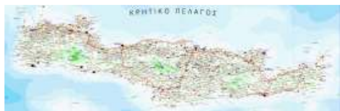
Χάρτης ερευνητικής ομάδας ΑΠΘ (Μπούτουρα, 1999).

στον Τομέα Κτηματολογίου, Φωτογραμμετρίας και Χαρτογραφίας του Τμήματος Αγρονόμων και Τοπογράφων Μηχανικών της Πολυτεχνικής Σχολής του ΑΠΘ, συμπληρώνουν την έκθεση.