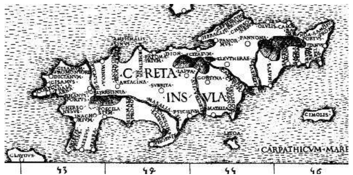
Η Κρήτη από πτολεμαϊκό χάρτη, τέλη 15ου αι.

ριοχή της (ναυτικοί χάρτες πορτολάνοι, τα νησολόγια, δηλαδή οι νησιωτικοί γεωγραφικοί άτλαντες του Αιγαίου, τα τοπογραφικά οχυρωματικά διαγράμματα-αποτυπώσεις). Ανάμεσα σ’ αυτήν την παραγωγή διακρίνεται και το έργο των λίγων ελλήνων χαρτογράφων νησιωτικής προέλευσης που εργάζονται στα ακμάζοντα βενετικά χαρτογραφικά εργαστήρια (Ξενοδόχος, Σιδέρης, Αντώνιος από τη Μήλο, Βουρδόπουλος).