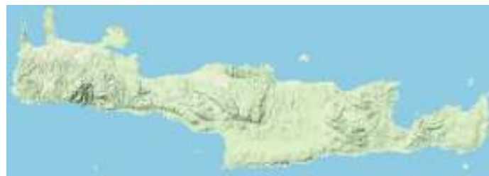
Δορυφορική εικόνα αναγλύφου της Κρήτης.