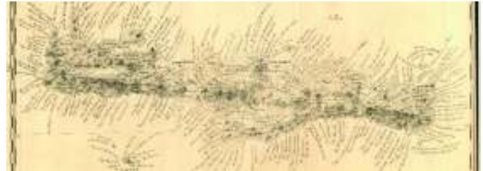
Από τον χάρτη του Aldenhoven, 1838.

Στην παράδοση της ελληνικής χαρτογραφικής κληρονομιάς του 18 ου αιώνα διαθέτουμε πολύ σημαντικές απεικονίσεις της Κρήτης, όπως μπορούμε να δούμε στους εμβληματικούς, για τη γεωγραφική ιστορία του Νεοελληνικού Διαφωτισμού, χάρτες του Ρήγα Βελεστινλή και του Άνθιμου Γαζή.