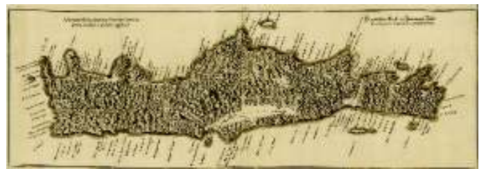
Η Κρήτη σε αναγεννησιακό χάρτη γερμανικής προέλευσης.

Αλλά και αργότερα, κατά τη διάρκεια της θεσμοθέτησης των προνομιακών εμπορικών σχέσεων ( Capitulations ) των μεγάλων δυτικών ναυτικών δυνάμεων με την Υψηλή Πύλη, όπως της Γαλλίας από τις αρχές του 16 ου αιώνα και της Αγγλίας και Ολλανδίας από τα τέλη του αιώνα αυτού, η Κρήτη συνεχίζει να απεικονίζεται προνομιακά στους ευρωπαϊκούς χάρτες της περιόδου, όπως και του 17 ου και 18 ου αιώνα, με διεύρυνση της σχετικής χαρτογραφικής παραγωγής (χάρης και στην ανάπτυξη που παρουσιάζει η υδρογραφική χαρτογράφηση), όταν ο ευρύτερος ελληνικός χώρος αποτελεί ένα μείζον γεωπολιτικό και γεωστρατηγικό διακύβευμα σε συνδυασμό με τη διαφαινόμενη κρίση της Οθωμανικής Αυτοκρατορίας.