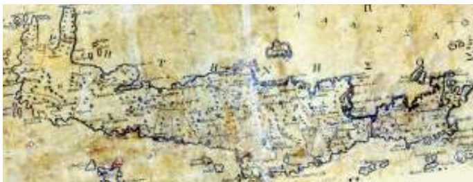
Από τη Χάρτα του Ρήγα Βελεστινλή, 1797.