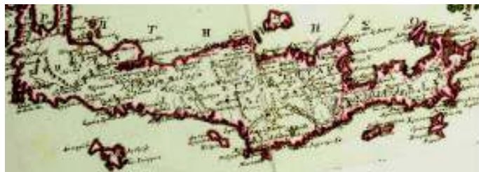
Από τον Πίνακα του Άνθιμου Γαζή, 1800.