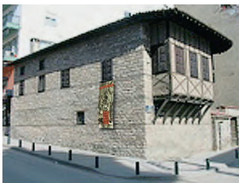
Το Αρχοντικό Λασσάνη (18ος αι.) στεγάζει από το 2008 τις δράσεις της Δημοτικής Χαρτοθήκης Κοζάνης.

Η μεγάλη παράδοση της Κοζάνης στα γράμματα ήδη από τον 17ο αιώνα, με κυρίαρχο σημείο αναφοράς τη γνωστή στο πανελλήνιο Βιβλιοθήκη, και μείζονα αναφορά στον Ελληνικό Διαφωτισμό, έρχεται σήμερα να συμπληρωθεί με την ίδρυση της Χαρτοθήκης της και τη στέγασή της στο Αρχοντικό Λασσάνη , το παραχωρημένο από το Υπουργείο Πολιτισμού και αποκαταστημένο από τον Δήμο Κοζάνης στίτι του κοζανίτη λόγιου