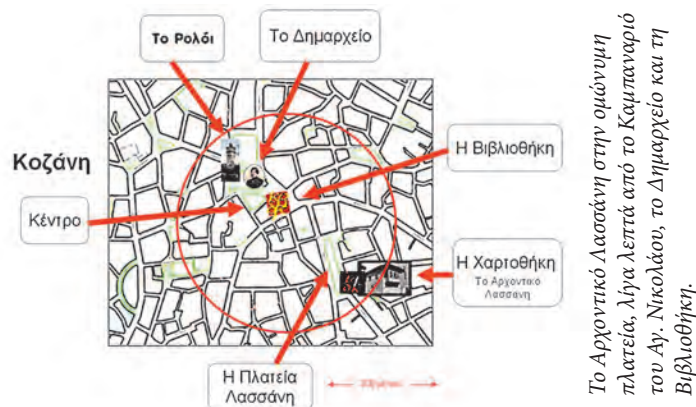
Το Αρχοντικό Λασσάνη στην ομώνυμη πλατεία, λίγα λεπτά από το Καμπαναριό του Αγ. Νικολάου, το Δημαρχείο και τη Βιβλιοθήκη.

Ο βασικός στόχος της προγραμματικής συνεργασίας για “την οργάνωση και ανάδειξη της Δημοτικής Χαρτοθήκης Κοζάνης” είναι να αποτελέσει η Χαρτοθήκη ένα φιλόδοξο