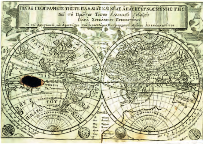
Αριστερά: Από την "Εισαγωγή στα Γεωγραφικά και Σφαιρικά" του Χρυσάνθου Νοταρά, Παρίσι 1716. Δεξιά: Από τη "Γραμματική Γεωγραφική" του Γεωργίου Φατζέα, Βενετία 1760 (Κοβεντάριος Δημοτική Βιβλιοθήκη Κοζάνης).